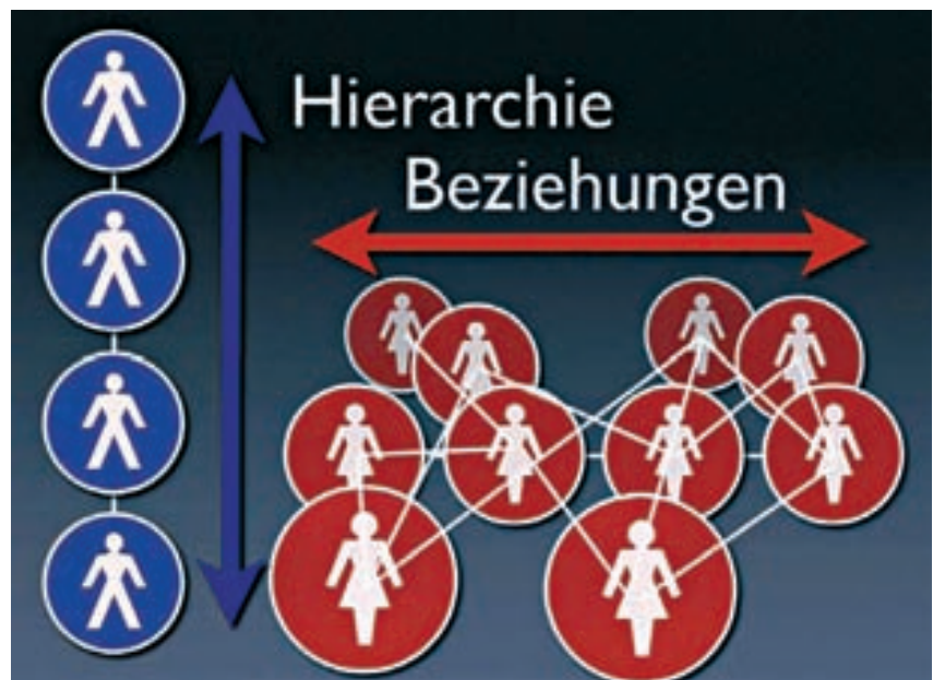
Bild 2: Männer brauchen Hierarchien, Frauen dagegen Beziehungen, also den Blick nach links und rechts sowie nach vorn und hinten

also sehr viele Aufgaben. Damals mussten die Frauen sehr viele Kinder hüten. Und es gab immer wieder Phasen, z. B., wenn sie sich zum Wäsche waschen am Fluss aufhielten, wo sie gar nicht auf ihre Kinder aufpassen konnten. Also mussten sie andere Frauen finden, die auf ihre Kinder Obacht gaben. Dazu braucht man keine Hierarchie, sondern ein Gespür für die anderen – vor allem ein Gespür dafür, wem man das wichtigste, das eigene Kind, anvertrauen kann. Und deshalb denken Frauen in Beziehungen, also waagerecht, niemals senkrecht. Frauen verstehen sich übrigens