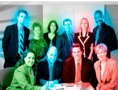
Persönlichkeitsstruktur-Analyse: Rot, Grün oder Blau?

Persönlichkeitsstruktur – Menschen „lesen“, verstehen und gewinnen